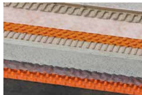
Schlüter-TROBA-PLUS 8 (12)

Pour les structures réalisées sur un lit de gravier ou de concassé d'épaisseur < 5 cm, un léger effet de ressort peut se produire. Afin d'éviter cet effet, nous recommandons de procéder à la pose sur Schlüter-TROBA, voir fiche technique produit 7.1.